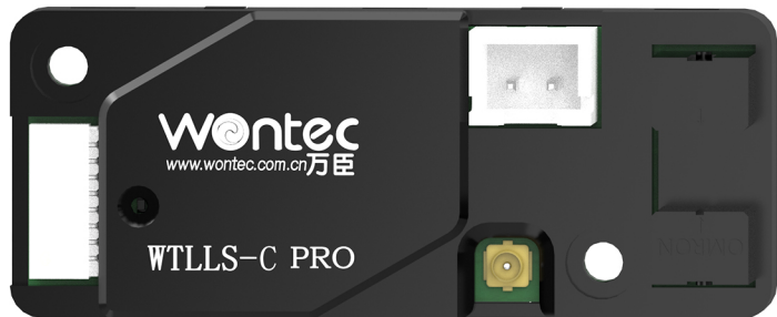
反馈型液面传感器 WTLLS-C PRO 反馈型 ·反馈型电容式液面探测，闭环控制更可靠。